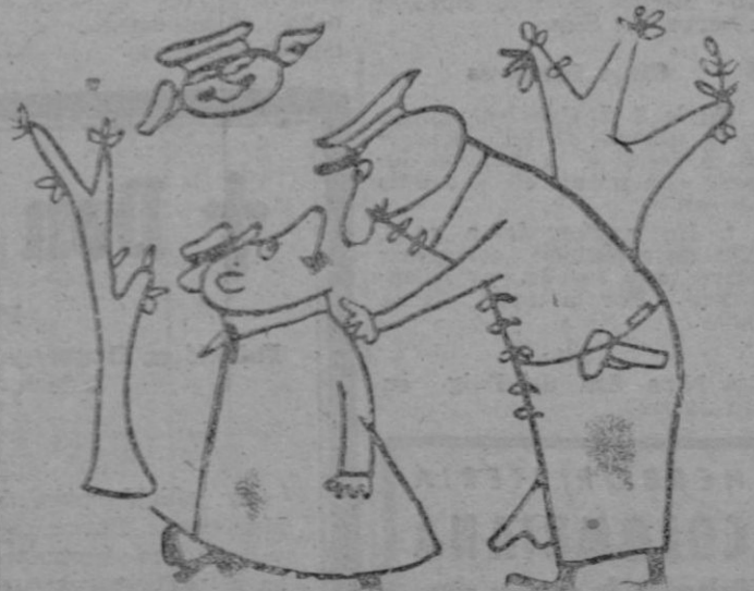
— Señor, percibe el olor característico de habers, quitado una mancha de su abrigo con benzina, y me permitiría recomendarle que se procure usted la correspondiente tarjeta de racionamiento para poder pagar la contribución. (De "Candido" Milán)