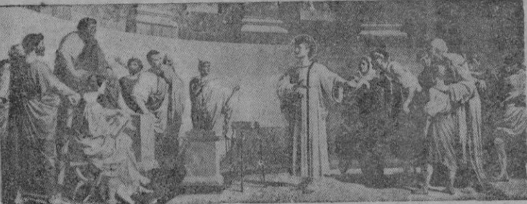
"He ahí nuestros tesoros." — Cuadro de Francassini

El Papa Pelagio trasladó de Jerusalem a Roma las re-