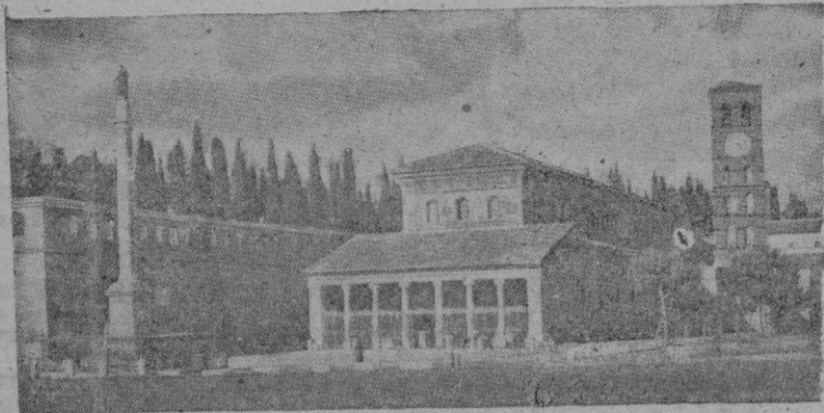
La basílica romana de San Lorenzo, extra-muros.

También Palma tiene una hermosa capilla dedicada al mártir Lorenzo