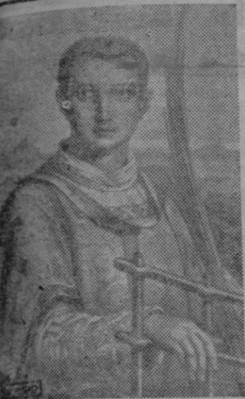
El diácono San Lorenzo, martirizado en Roma en el siglo III, y cuya cuna fue probablemente la ciudad española de Huesca

LA ASUNCION, 9 (Efe). — Se ha efectuado entre el gobierno del Paraguay y el ministro de España, Sr. Teus un canje de notas en virtud del cual comenzarán próximamente en esta capital unas conversaciones con objeto de concluir un tratado de amistad entre ambos países. Dicho tratado servirá de base para el estudio de subsiguientes convenios de índole económica y financiera de trabajo y cultura.