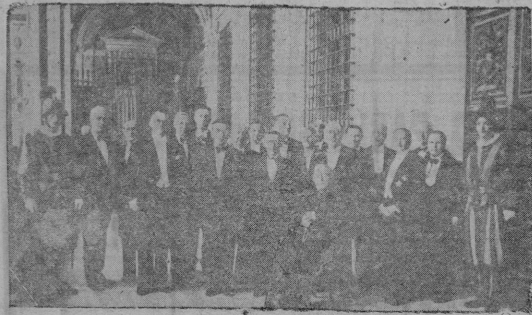
La Academia de Ciencias Pontificia ha celebrado un Congreso Internacional de investigadores en cuestiones cancerosas, quienes se han reunido para cambiar impresiones y coordinar sus experiencias en lucha contra el cáncer. Han asistido al mismo eminentes congresistas de varios países, los cuales aparecen reunidos en la foto momentos después de ser recibidos por el Santo Padre.