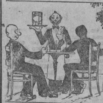
Los Barquillos Galindo son el complemento de un buen helado, se fabrican en todos los gustos. Calidades inmejorables. Calle Cordelería núm. 14.

Sean bienvenidos y que se lleven de Mallorca grato recuerdo.