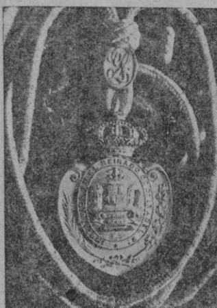
La medalla que ayer recibió el Excmo. Sr. Gobernador Civil.