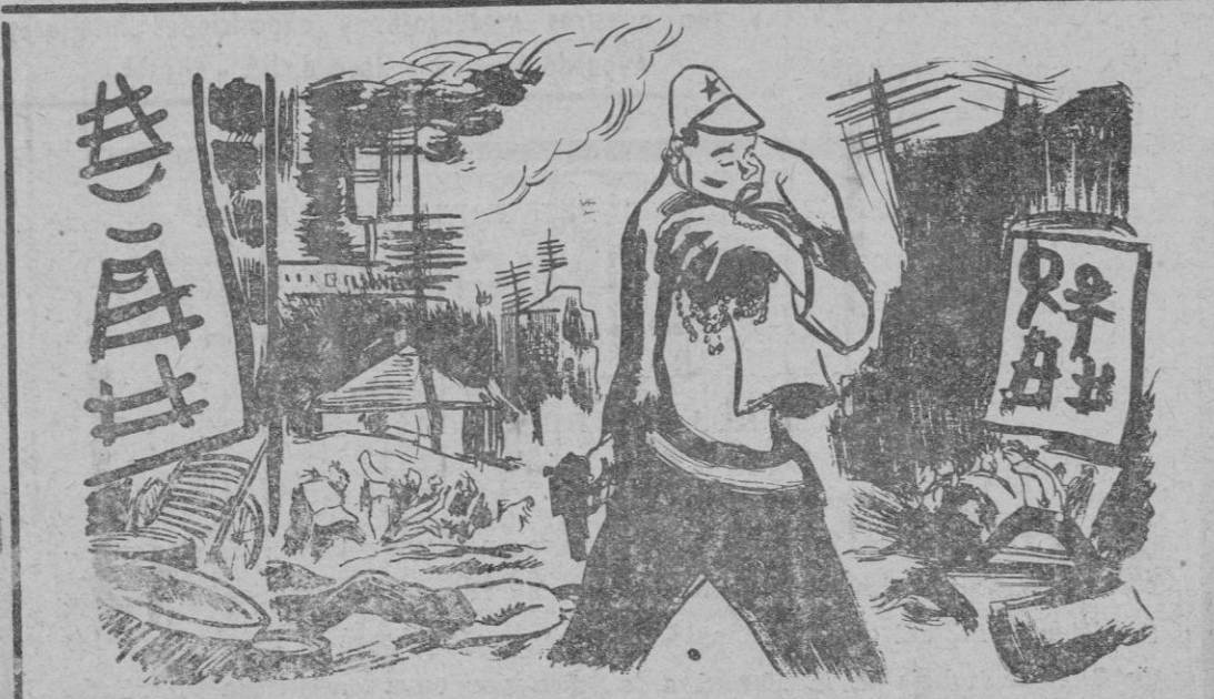
SHANGHAI Continúa el avance de la paz soviética. (De "Mare Aurelio" - Roma)

Después se verificará en los astilleros de la Unión Naval de Levante la inauguración de la capilla reconstruida después de la guerra; la bendición de una imagen de Ntra. Sra. de los Desamparados y la bendición del petrolero "Aruba" de 10975 toneladas construido para la empresa nacional Elcano.