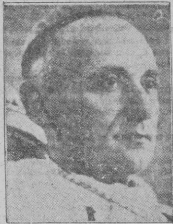
El Cardenal Mindszenty

Esta asociación de países no tiene nada reglamentado ni escrito y se funda sobre la buena voluntad de los diversos países integrantes, entre los cuales se encuentra África del Sur que no hace mucho estuvo contra Inglaterra la guerra de los Bóers, que hoy es una de las más leales par-