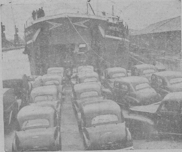
El "Empire Baltic", antiguo transporte de tanques, se destina ahora a la exportación de coches, de los cuales puede admitir 190 en condiciones inmejorables.