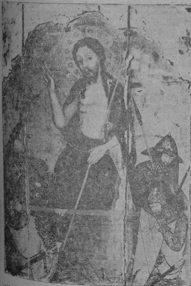
La tumba de la Resurrección que se guarda en el Museo Provincial de la Lituja