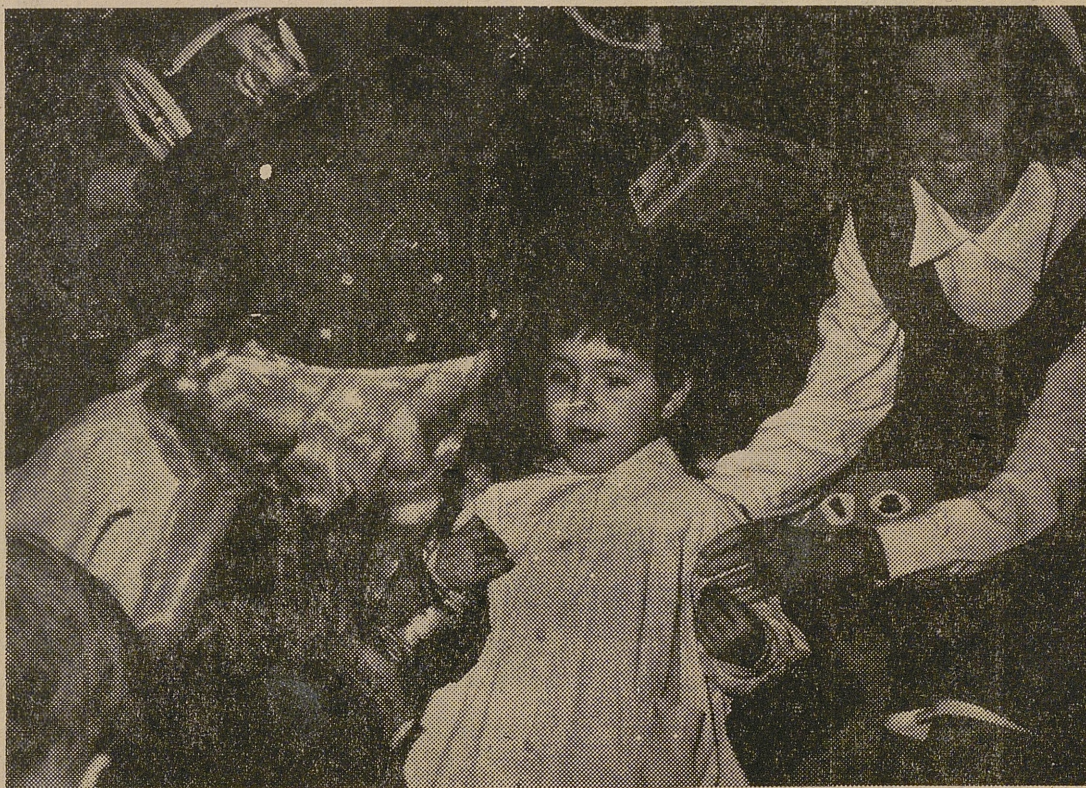
Un momento de la visita de Sus Majestades de Oriente a la Guardería Infantil de Auxilio Social.