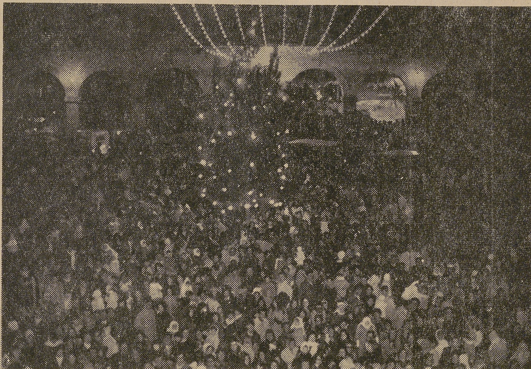
Aspecto que ofrecía la plaza del Mercado Chico, a la llegada de la Cabalgata de los Reyes Magos.

Después de bajar de los lujosos coches, en los que recorrieron Avila, fueron recibidos a la puerta del Ayuntamiento