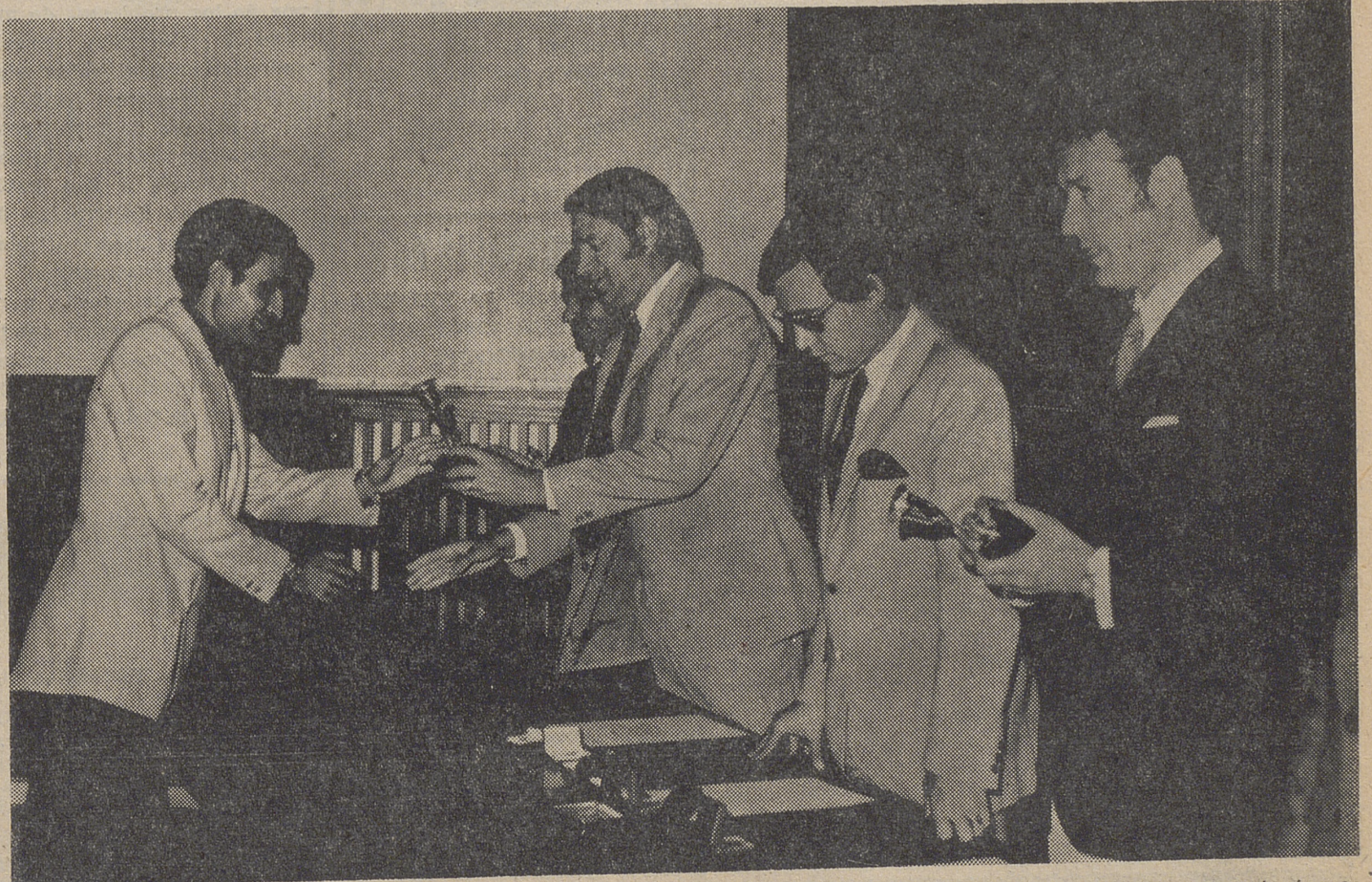
Un brillante acto académico cerró ayer los Cursos Nacionales de Idiomas y de Preuniversitario para extranjeros, que durante este mes se han desarrollado en el Colegio