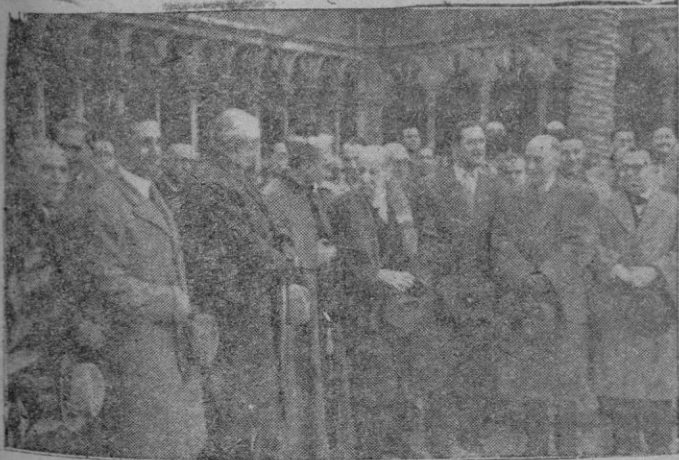
Las Autoridades y los periclistas en el claustro de San Francisco, después de la solemne misa celebrada ayer en honor del Patrono de éstos