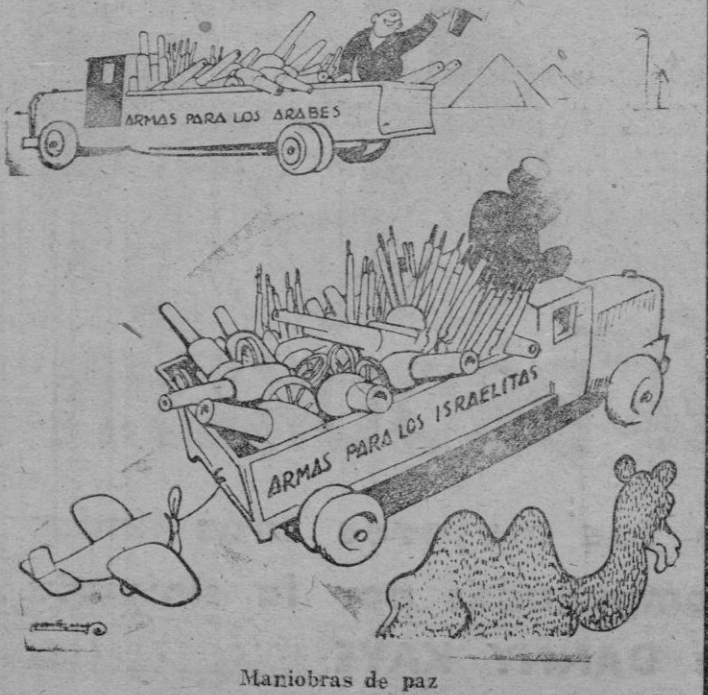
Maniobras de paz