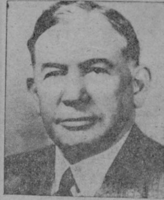
ALBER W. BARKLEY

Su triunfo en la Convención del pasado mes de julio, cuando hubo que elegir candidato frente al prestigio de que goza Warren, gobernador de California, demuestra la confianza que en el nuevo vicepresidente depositaron sus correligionarios. Hizo después una campaña eficaz, aunque no ruidosa. Poca publicidad, casi ninguna estridencia, nada de actos espectacularidad. Y logró junto a Truman, la victoria más notable e inesperada que registra los anales de la política norteamericana.