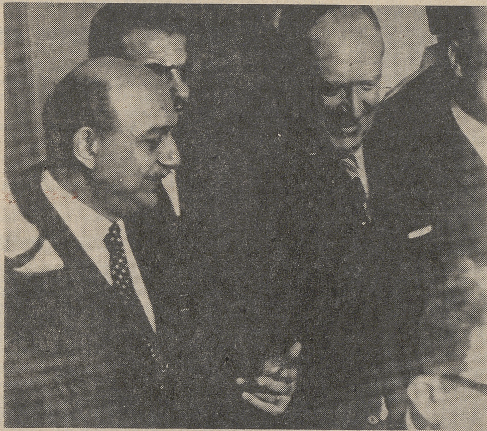
El secretario de Estado norteamericano Williams Rogers (derecha), conversa con el ministro egipcio de Asuntos Exteriores, Mahamoud Riad, en El Cairo, a donde llegó para mantener conversaciones sobre el Oriente medio.