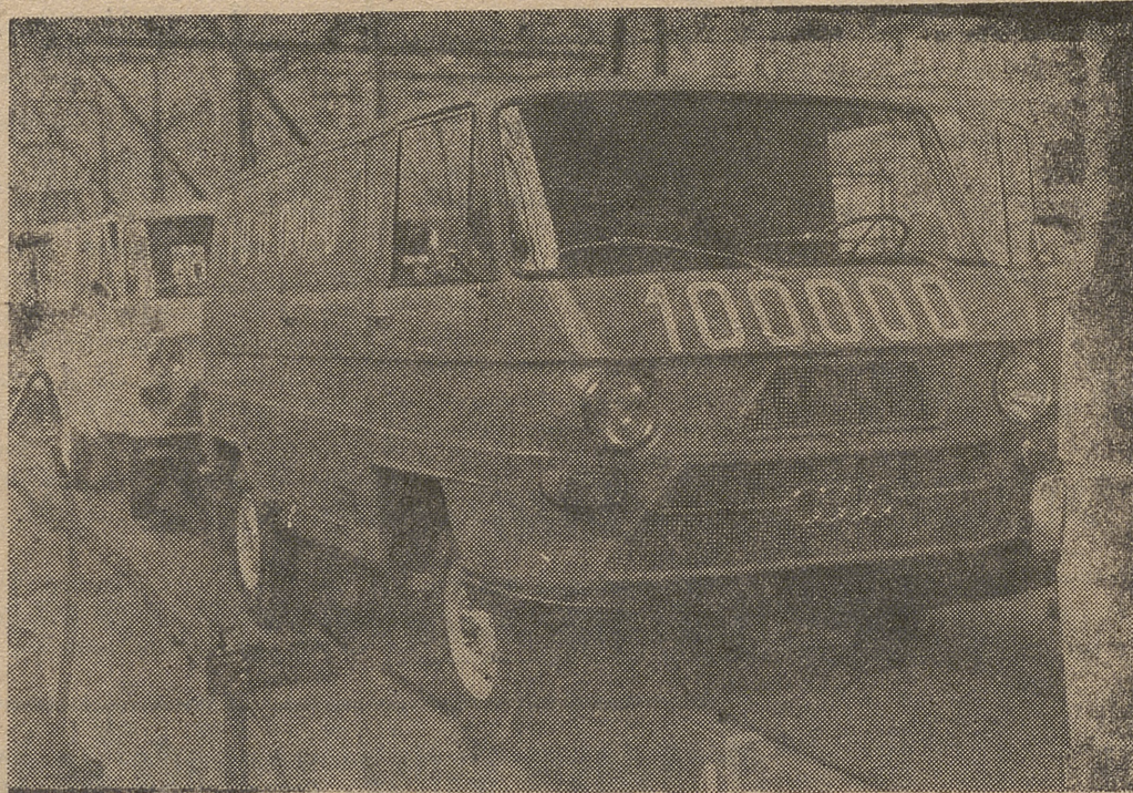
La unidad 100.000 de DKW en una de las líneas de montaje de IMOSA

En las factorías de IMOSA en Ali (Vitoria), reina estos días una fundada satisfacción. Acaba de salir de sus cadenas de fabricación la DKW que hace la unidad número 100.000 de las hasta ahora fabricadas.