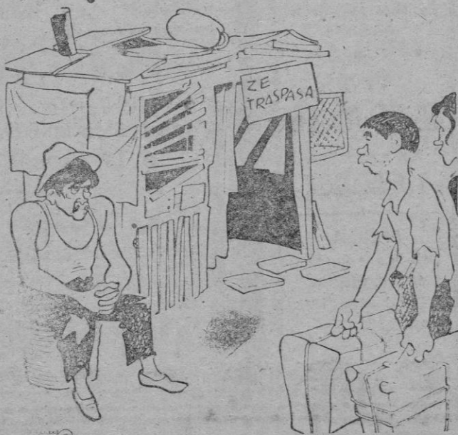
—BUENO, ¿CON O SIN MUEBLES?