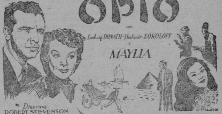
Director: ROBERT STEVENSON

¡¡Una mujer que deja una huella más terrible que la muerte!!