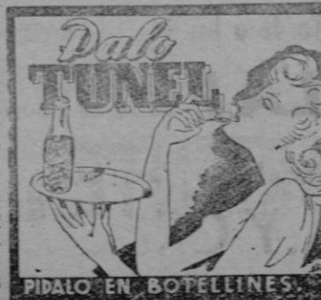
PÍDALO EN BOTELLINES

Lea Vd. todos los días CORREO DE MALLORCA