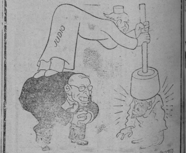
El tramancero. — Ni quito ni pongo rey, pero ayudo a mi elector.