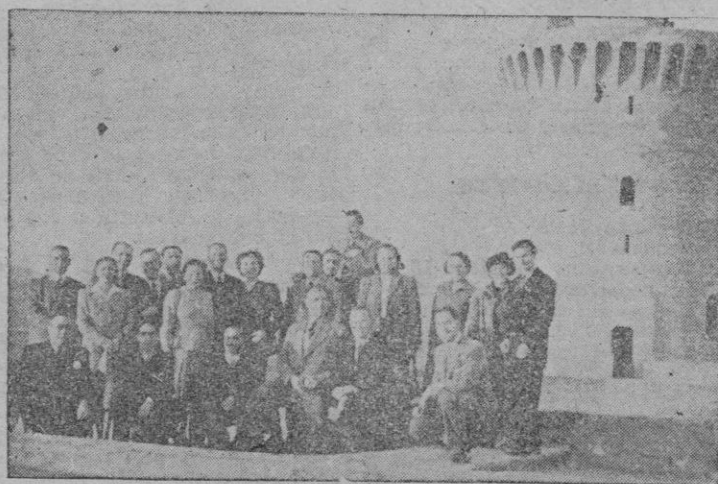
Los representantes de las Agencias extranjeras de Viajes que llegaron anteayer a Palma, en su visita al Castillo de Bellver.