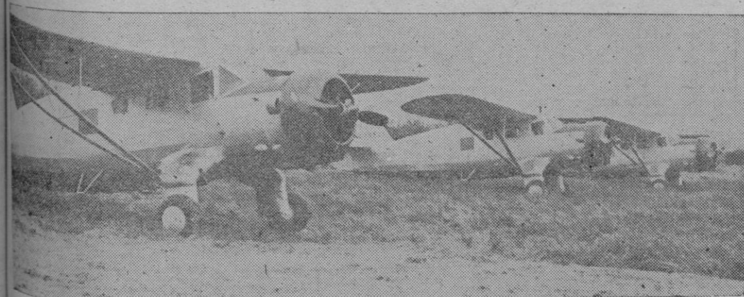
Norteamérica ha enviado repetidas veces a China auxilios en material bélico y también aviones de diversos tipos

Visiten nuestros escaparates y exposiciones interiores Avenida Alejandro Roselló, 115 - PALMA