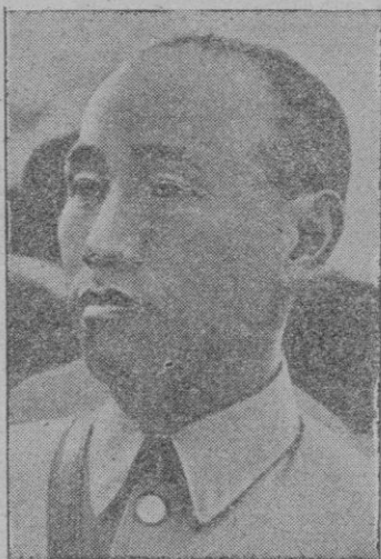
El general Chang-Kai-Chek

Si bien la actitud de los americanos respecto al mariscal chino ha sido bastante vacilante. Cuando en 1945 el peligro co-