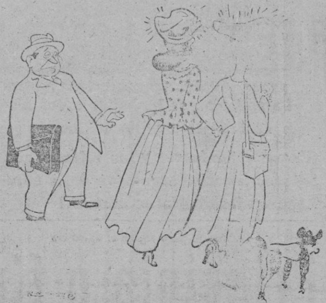
—Ya me suponía yo que el plexiglás, al final, se les subiría a la cabeza.