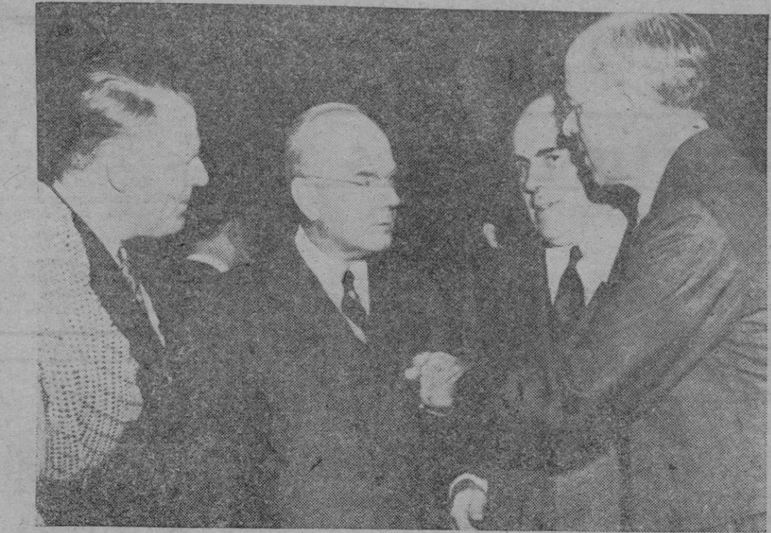
El Caudillo y su familia en la coronación de la Virgen de la Almudena.