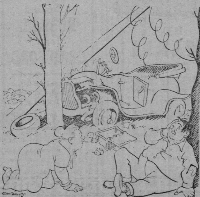
—Bueno, podríamos quedarnos a comer aquí.