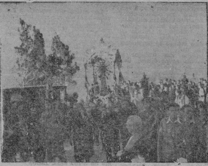
Foto retrospectiva. — La venerada imagen de la Virgen de San Salvador, trasladada procesionalmente, después de coronada pontificalmente, desde Felanitx a su Santuario.

La Comunidad de PP. Teat-inos, secundada por las asocia-ciones establecidas en su igle-sia de San Alfonso, muy de mañana se dirigieron cantando