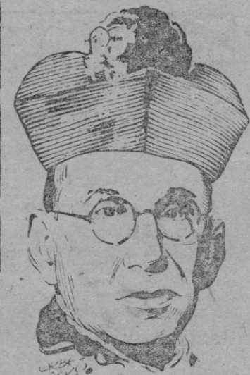
EL CARDENAL ARCE

TARRAGONA, 16. (Efe). — A última hora de la tarde llegó al Palacio Arzobispal el Cardenal Arce Ochotorena que in-