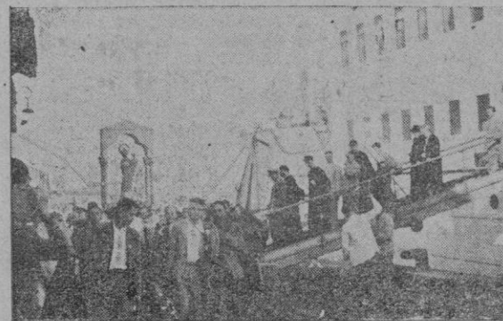
La primera foto nos muestra a la imagen de la Virgen de Lluich después de haber desembarcado del "Ciudad de Palma". En la segunda pasa la Virgen acompañada de los jóvenes peregrinos entre compacta multitud que la aclama con entusiasmo

La Asamblea Nacional de las Asociaciones de la Prensa será inaugurada día 6. Estarán representadas en ella veinte asociaciones de toda España y han comenzado a llegar los miembros asambleístas.