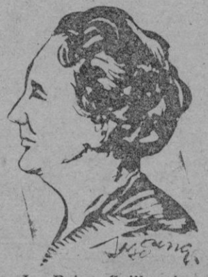
La Reina Guillermina de Holanda

Se calcula en un millón el número de personas que han estado hoy en la plaza Real de Amsterdam para ver a la reina por última vez como soberana. 16 000 adultos y 3.000 niños han cantado en su honor diversas composiciones musicales, acogidas con interminables aclamaciones a la reina y a sus nietos cuando se presentaron en el balcón de Palacio. Los treinta y tres cañones de la salva de ordenanzas se dispararon por el portavoz "Kael Rodrak" surto en este puerto.