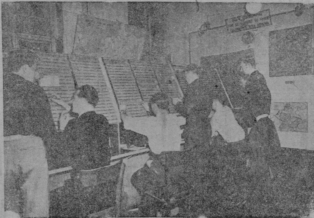
Quando los aliados ocuparon Alemania, establecieron un Centro de Seguridad Aérea en Berlín, dividido en cuatro zonas. Según tales proyectos, existía el propósito de que representantes de los Estados Unidos, Inglaterra, Rusia y Francia, dieran información diaria y detallada para poder efectuar sus vuelos con mútua garantía, sin olvidar la más rigurosa observación de las reglas del vuelo en las respectivas zonas. Planteado el grave problema de Berlín, norteamericanos, ingleses y franceses, prescindiendo de los soviets, siguen trabajando juntos e interesadamente en el Centro antes citado. Así lo reagemos en nuestra fotografía, que reproduce a los funcionarios encargados del mismo en plena actividad.