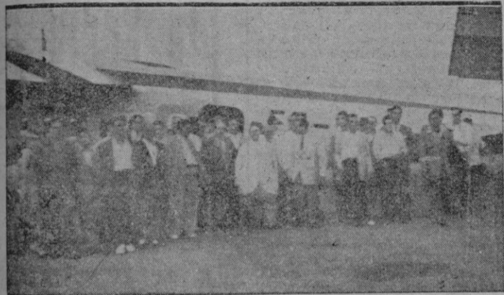
Portugueses y españoles al descender ayer del avión

Remontándome pues, a lo que decía en un principio, de que todo tiene su epilogo, también lo tiene el acontecimiento internacional de esta noche. Llegamos como digo a las últimas etapas de unas jornadas vividas