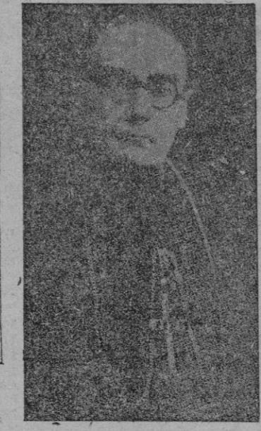
El Cardenal Legado

Ibáñez Martín, asistió esta tarde a la recepción ofrecida en el Palacio Arzobispal en honor del Cardenal Primado de las Españas y Legado Pontificio, Dr. Plá y Deniel. El Ministro ostentará la representación de S. E. el Jefe del Estado, en las ceremonias que se celebrarán con motivo de la Peregrinación Mundial de la Juventud.