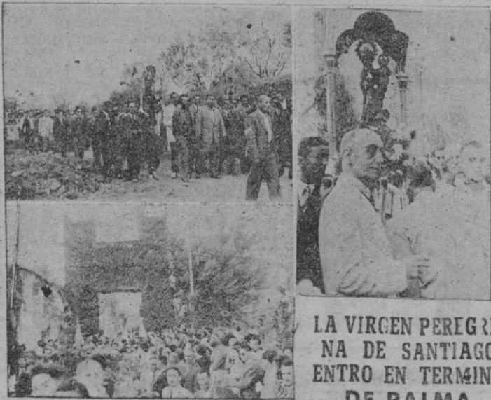
LA VIRGEN PEREGRINA DE SANTIAGO ENTRA EN TERMINO DE PALMA

PARIS, 26. (Efe). — El único partido político importante que no se ha incluido en el nuevo Gobierno francés es el comunista.