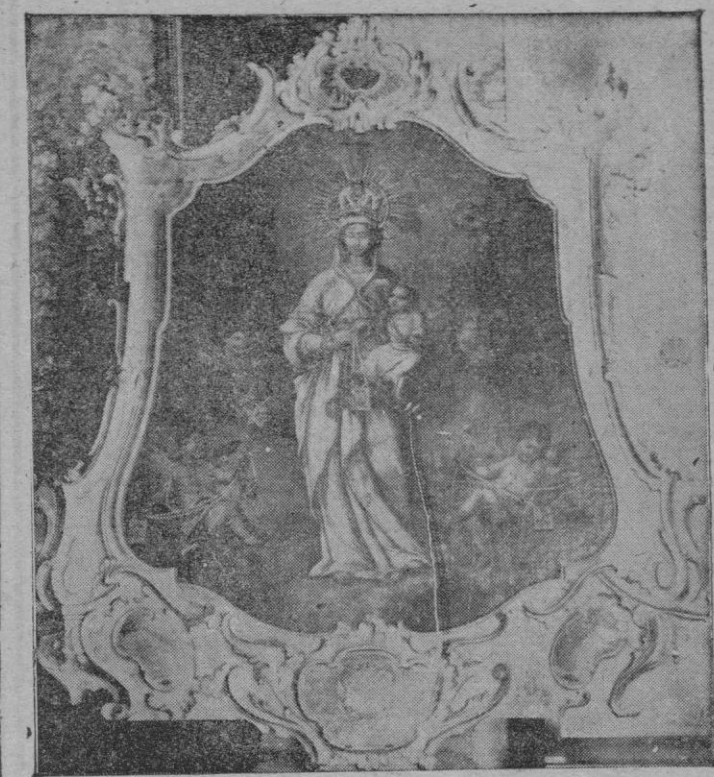
Hoy celebra la Iglesia la festividad de Nuestra Señora del Carmen a la cual escogió la Marina como Patrona celestial. La foto nos ofrece un cuadro de la Virgen del Carmen que perteneció al ilustre marino mallorquín el famoso general Barceló.

Se cree que mañana comenzarán a funcionar también algunos medios de transporte.