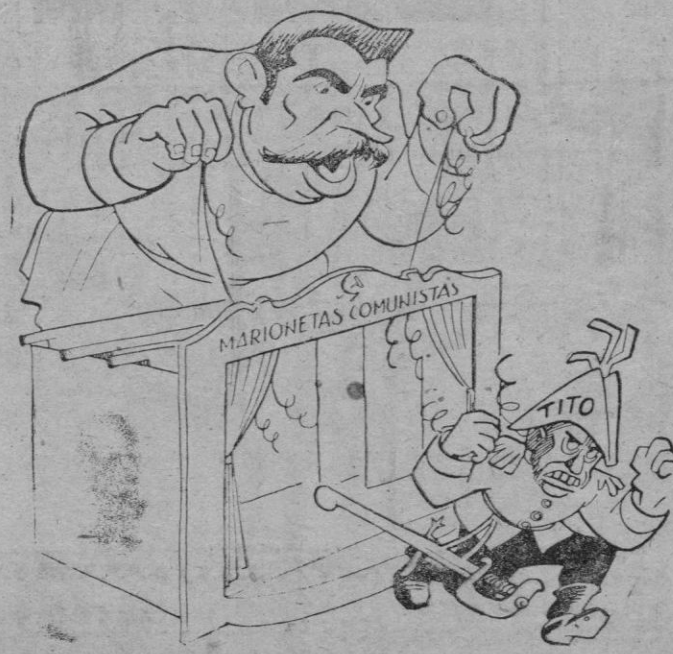
Una marioneta que se emancipa