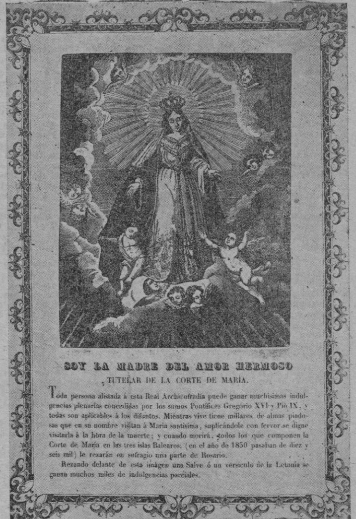
SOY LA MADRE DEL AMOR HERMOSO TUTELAR DE LA CORTE DE MARÍA.

Todas las autoridades y cuanto de ilustre encierra esta población se esmeraron a porfía en solemnizar entre nosotros la inauguración de la Corte de María; quizá el brillo con que se ha inaugurado en Palma ha eclipsado el modo pomposo con que se instaló en otras Provincias del continente que han saludado también con entusiasmo esta devoción. Al ver la honrosa cooperación que los hom-