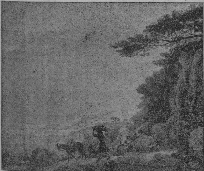
Oleo de Mateo Vidal Riera

celebrando en dicha población, expone una interesante exposición de oleos el pintor Mateo Vidal Riera.