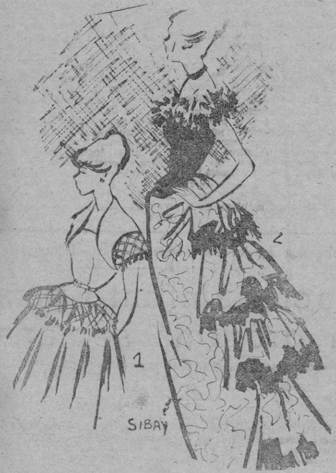
1. A este conjunto verde aceituna, le denominaban "Renacimiento de ciudad". Falda con tabloncillos y aplicaciones de punto en color crudo. Torera muy corta. — 2. Traje de noche, recordando los del 1885. Falda estampada en rosa palo, negro y blanco, recogida atrás con volantes. Cuerpo negro de raso y un volante alrededor del escote en tul, también negro.

Hermine. La diversidad de modelos, algunos aspectos de los mismos y el haber sido presentada incompleta la colección, nos visto destacaban unos trajes de campo y playa en piqué