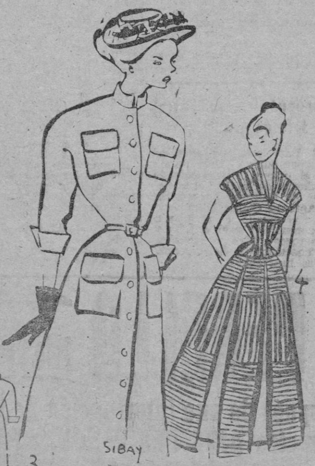
3. Modelo en gris beige con cuatro bolsillos; abierto de arriba abajo. Delantero liso y un pliegue hondo en la parte de atrás. 4. Vestido para campo en piqué blanco, dentro de los tabloncillos rojo y azul marino.

Hermine. La diversidad de modelos, algunos aspectos de los mismos y el haber sido presentada incompleta la colección, nos visto destacaban unos trajes de campo y playa en piqué