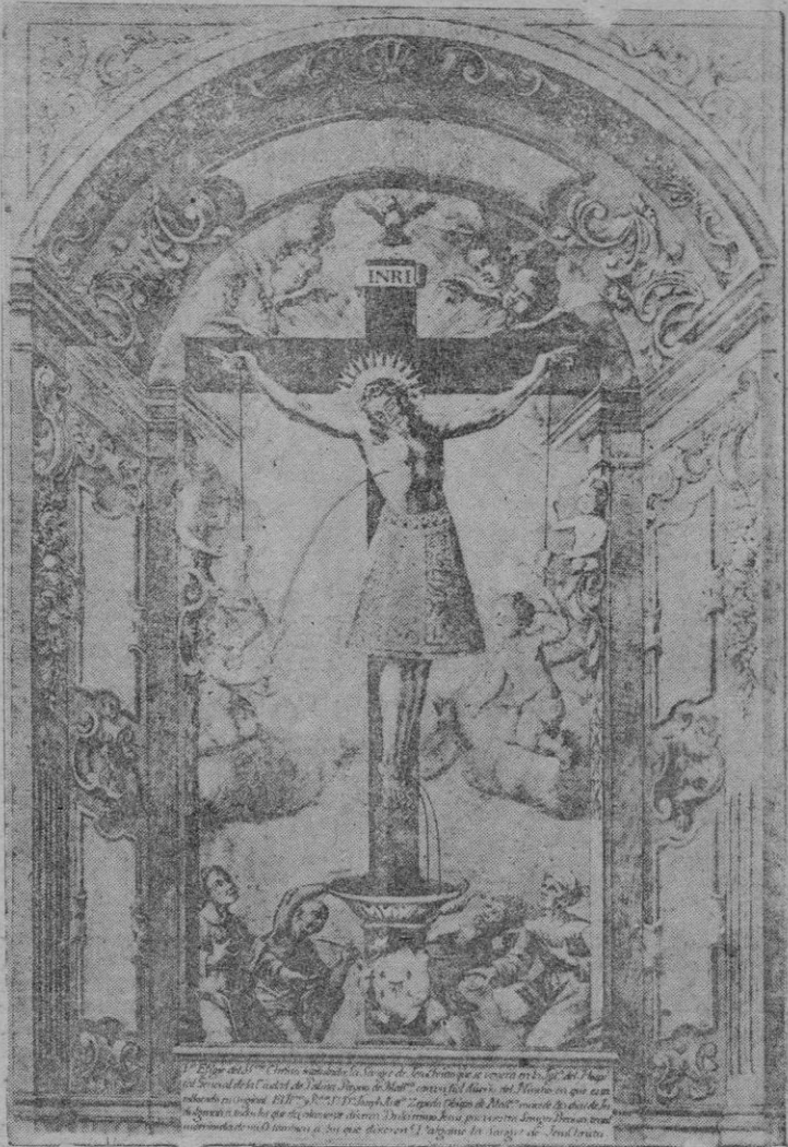
El Santo Cristo de la Sangre. (De la colección de D. Tomás Ripoll, grabado por Muntaner).