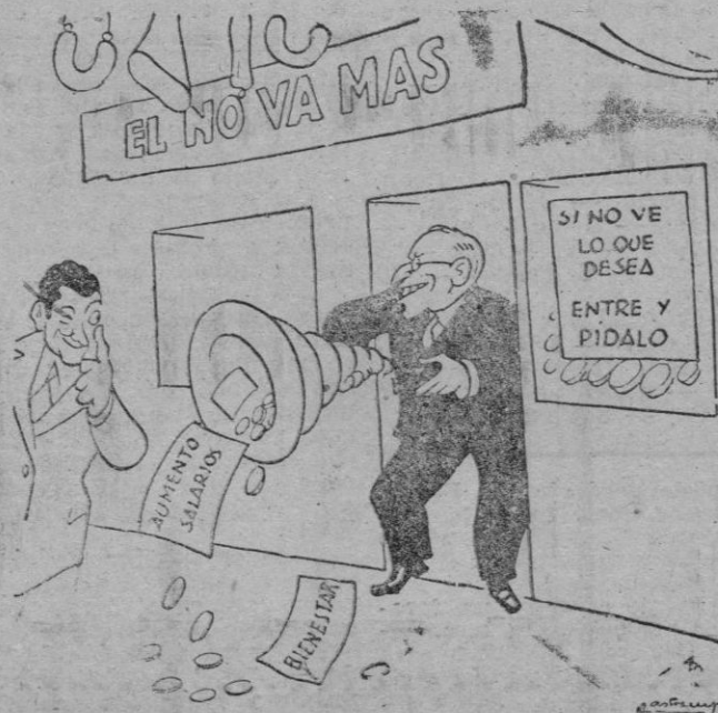
El señor Truman prosigue la campaña de reelección presidencial.