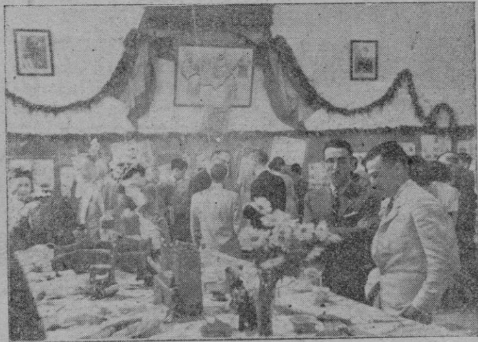
Un aspecto de la Exposición Escolar

folklore provincial. Nuestros pueblos están representados por sendas láminas en las que se exponen sus características históricas - geográficas - económicas. En el centro, preciosas labores de bordado mallorquín alternan con maquetas y muñecos perfectísimos, hasta en sus más pequeños detalles, al lado de un monumental mapa de Mallorca luminoso.