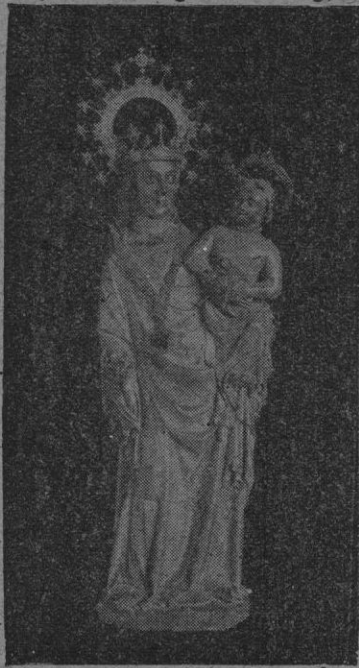
La imagen de Nuestra Señora del Puig de Pollensa

multitud, jóvenes, niños, autoridades, mujeres, en manifestación pacífica espiritual, acompañando a la que proclaman y es Reina de los mares, en ruta hacia las