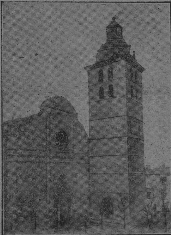
La iglesia parroquial de Inca

apuntando todo lo que había en ellas. Pues bien, a este hombre benemérito se le debería dedicar una calle o plaza en cada pueblo que visitó, allá entre los años 1790-95. Junio del #8.