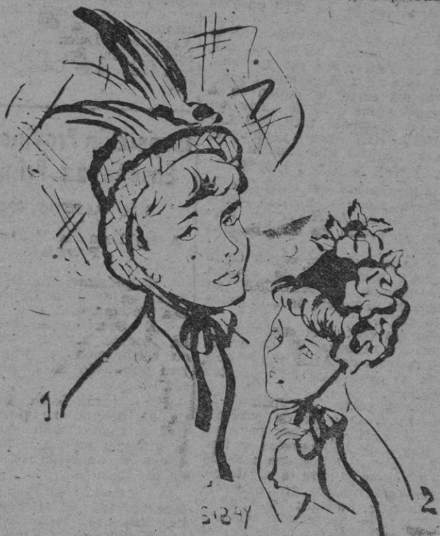
1. En paillason natural con pájaro de plumas multicolores. Velo de tul. — 2. Toca forrada de satén negro con tres grandes rosas encarnadas. Lazo anudado en la barbilla.

Velos de encaje Chantilly, de sencillos dibujos, pero de exquisita calidad, pocos cubriendo la cara, pero muchos echados hacia atrás, cubriendo la copa y alas del sombrero y otros anudados en la barbilla.