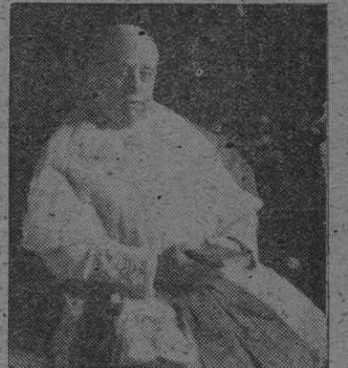
Don Miguel Costa y Llobera

carla desde lejos, sin recordar mentalmente esta bellísima salutación. Por estar penetrado de su espíritu, se le anuda a uno la voz en la garganta cuando quiere cantarla, y se le humedecen los ojos de ternura y purísima emoción cuando la escucha entonada por una multitud