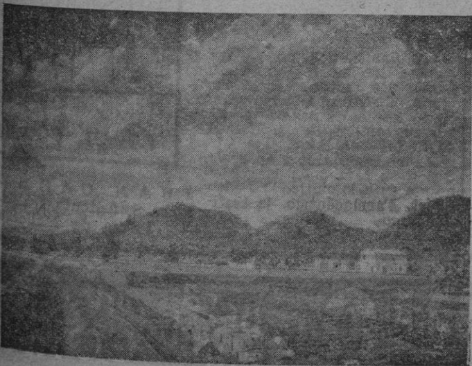
"Camino", óleo de Guillermo V adell, que figura en la Exposición Nacional de Bellas Artes

siempre está la sinceridad en el aplauso incondicional. G. C.