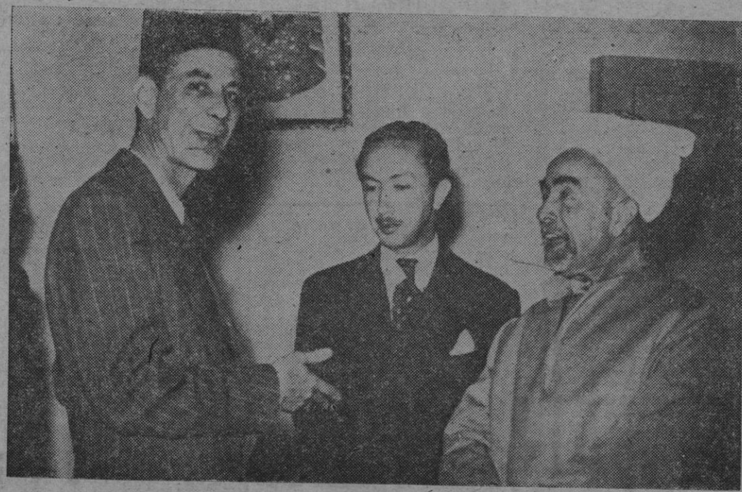
Personalidades de actualidad: el rey Abdullah de Transjordania (derecha), comandante en jefe de las fuerzas musulmanas en guerra contra el Sionismo, conv ersando con Abdul Rakman Azzan Pashá, secretario general de la Liga Árabe. Entre ambos aparece el emir Abdul Hah regente del Irak y sobrino del rey Abdullah.