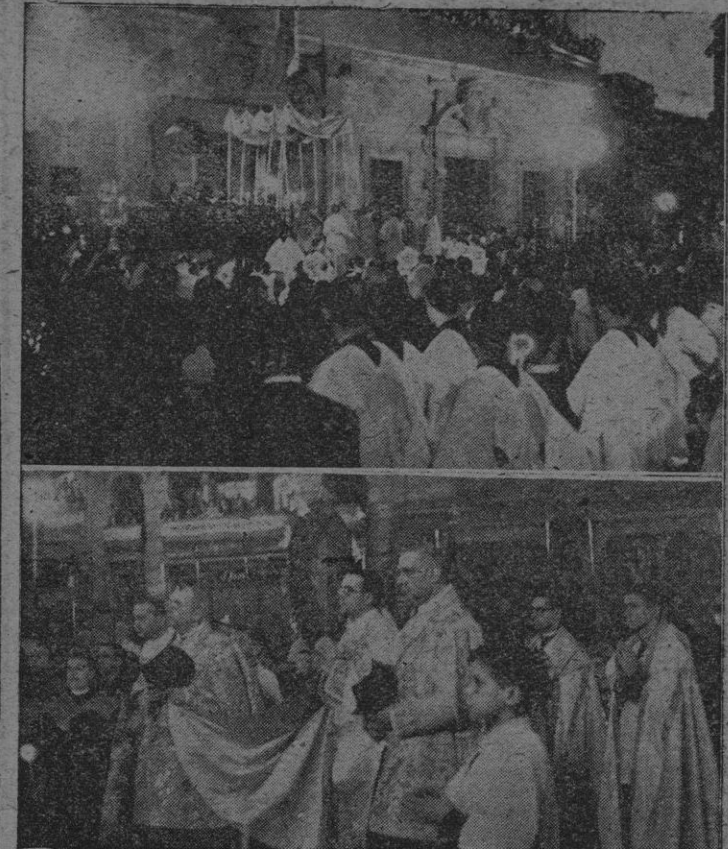
La foto superior recoge el momento emocionante en que la Sagrada Hostia era adorada en el altar colocado en la Plaza de Cort. En la segunda vemos al Excmo. y Rdm. Sr. Obispo revestido de Pontifical y asistido de M. Hfres. Capitulares formando la presidencia litúrgica.