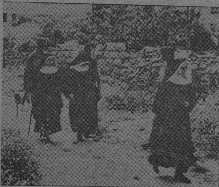
Tres monjas salen protegidas por las fuerzas del Haganah, del convento de Santa Teresa, en el momento en que se desarrolla la batalla de Katamon, suburbio de Jerusalén. Los judíos ocuparon una considerable extensión de terreno y acompañaron a las religiosas a sitio seguro.