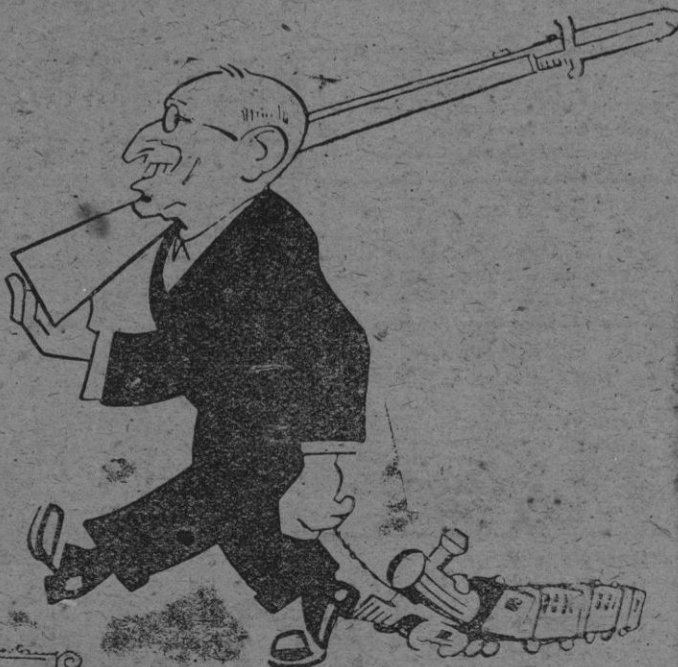
EL TRUMANCERO. — ¡CON LOS TRENES NO SE JUEGA!