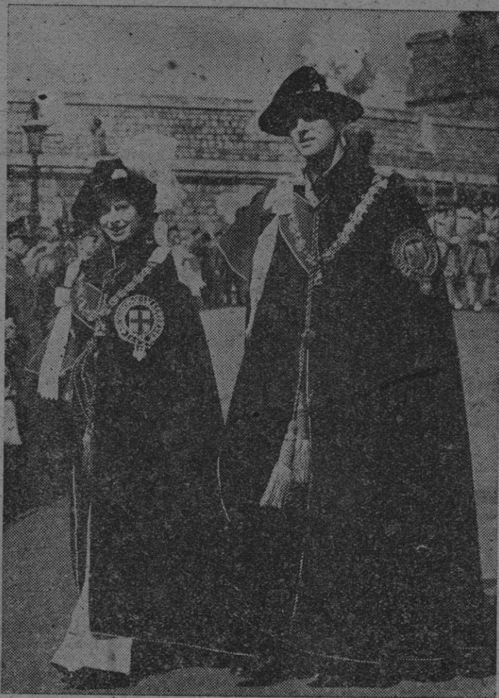
En ocasión de celebrarse el 600 aniversario de la Orden de la Jarretera han recibido el honor de ingresar en la citada Orden los duques de Edimburgo. Con este motivo ha tenido lugar una ceremonia especial de inusitado esplendor. En la "foto" vemos a los nuevos caballeros de la Jarretera con su vestido de gala, es decir, a la princesa Isabel, heredera del trono de Inglaterra, y a su esposo el duque de Edimburgo.