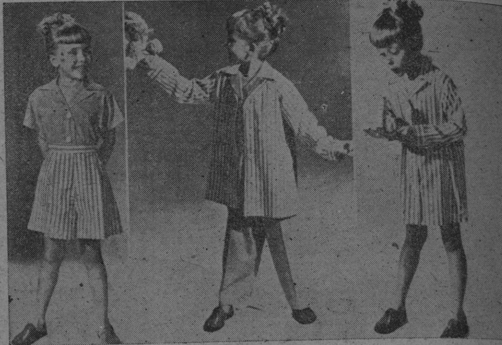
Con las piezas del traje que aparece en la foto, se puede salir de paseo, estar en casa y dormir, según las combinaciones que con dichas prendas se haga. Es la última palabra de la moda infantil norteamericana. Brindamos la idea a los miembros permanentes de la O. N. U., que discuten en Lake Success el problema de Palestina.