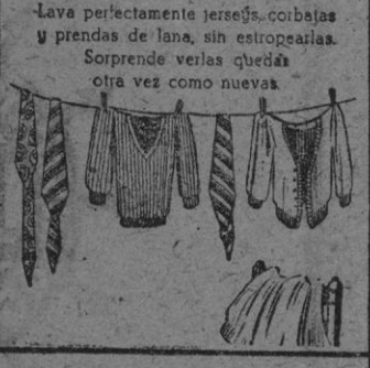
Lava perfectamente jerseys, corbatas y prendas de lana, sin estropearlas. Sorprende verlas quedar otra vez como nuevas.