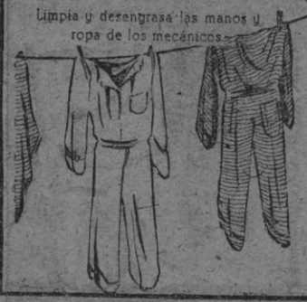
Limpia y desengrasa las manos y ropa de los mecánicos.