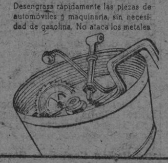
Desengrasa rápidamente las piezas de automóviles y maquinaria, sin necesidad de gasolina. No ataca los metales.