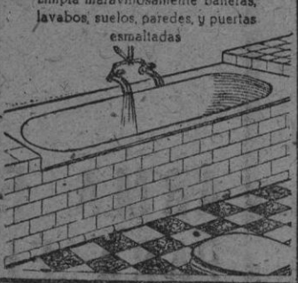
Limpia maravillosamente bañeras, lavabos, suelos, paredes, y puertas esmaltadas.