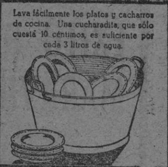
Lava fácilmente los platos y cacharros de cocina. Una cucharadita, que sólo cuesta 10 céntimos, es suficiente por cada 3 litros de agua.