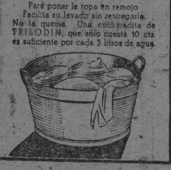
Para poner la ropa en remojo. Facilita su lavado sin restregarla. No la quema. Una cucharadita de TRISODIN, que sólo cuesta 10 cts., es suficiente por cada 3 litros de agua.