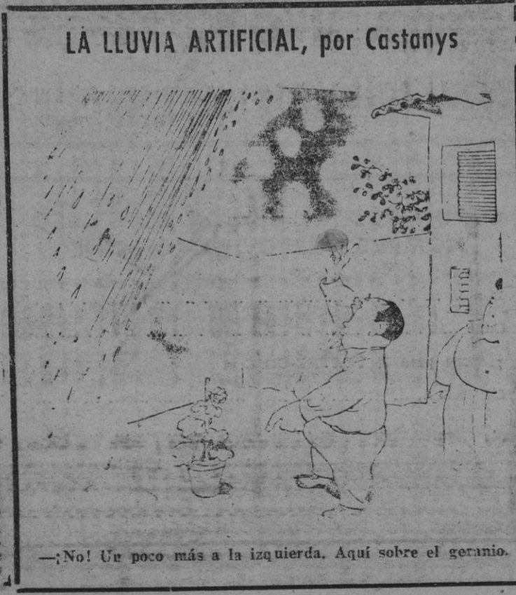
—¡No! Un poco más a la izquierda. Aquí sobre el geranio.

BURGOS, 10 (Cifra). — Se ha confirmado que el avión que cayó en el término de Pineda de La Sierra es el que buscaba el Gobierno francés estos últimos días.