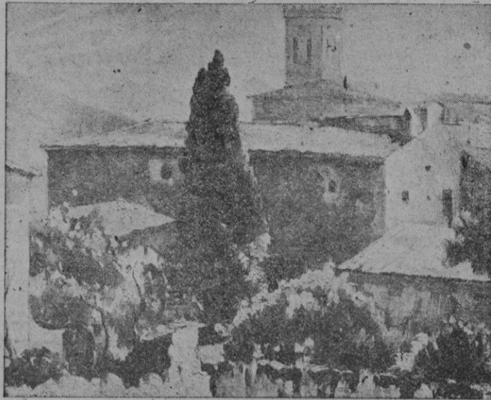
os, expuesto en las Galerías Costa «POLLENSA» óleo de Valentín Uri

En sus retratos persigue una fidelidad descrita con pincel inspirado: la testa de la Srta. Alabern está construida con elegancia y finura; el retrato del Sr.