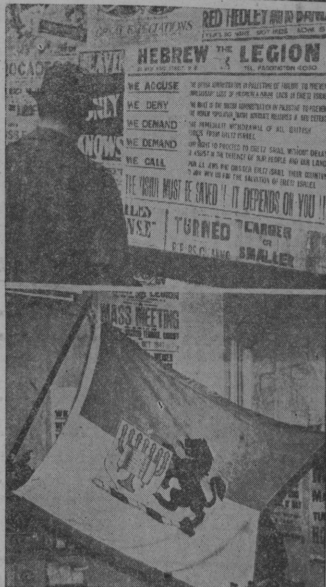
Estos carteles fijados en las paredes de Londres, llaman a filas a los judíos británicos para que se inscriban en la Legión Hebrea en la lucha por la libertad del Eretz Israel. El mayor Samuel Weiser, fundador de la Legión, ha declarado que, mediante tales carteles, se han reclutado ya 2.000 jóvenes. (Abajo): La bandera de la Legión que «luchará por los derechos de los judíos»