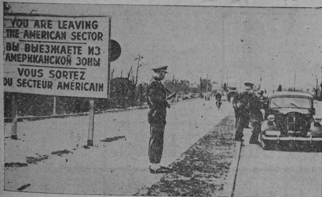
Como réplica a la actitud soviética de no permitir el tráfico ferroviario anglosajón a través de su zona en Alemania, los norteamericanos establecieron un severo control en la carretera que une a Postdam con Berlín. La foto recoge el momento en que los policías yanquis comprueban la documentación de los ocupantes del coche.