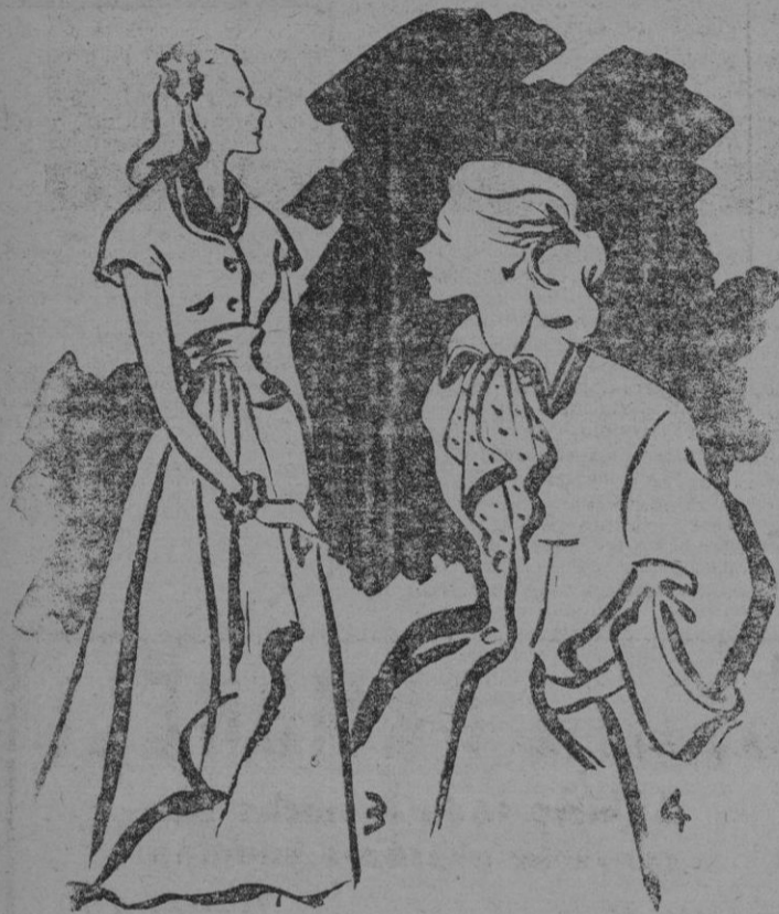
3. — Vestido en gasé verde aceituno con gran lazada marcada el talle; caída a lo largo de la falda. — 4. Abrigo de entretiempo en gabardina gris perla con caderas muy marcadas mangas amplias y «fou lardé» en satén verde bordado en soutach negro.

eplendrosos por las bellas modelos en todos los salnes de los modistos de nuestra ciudad.