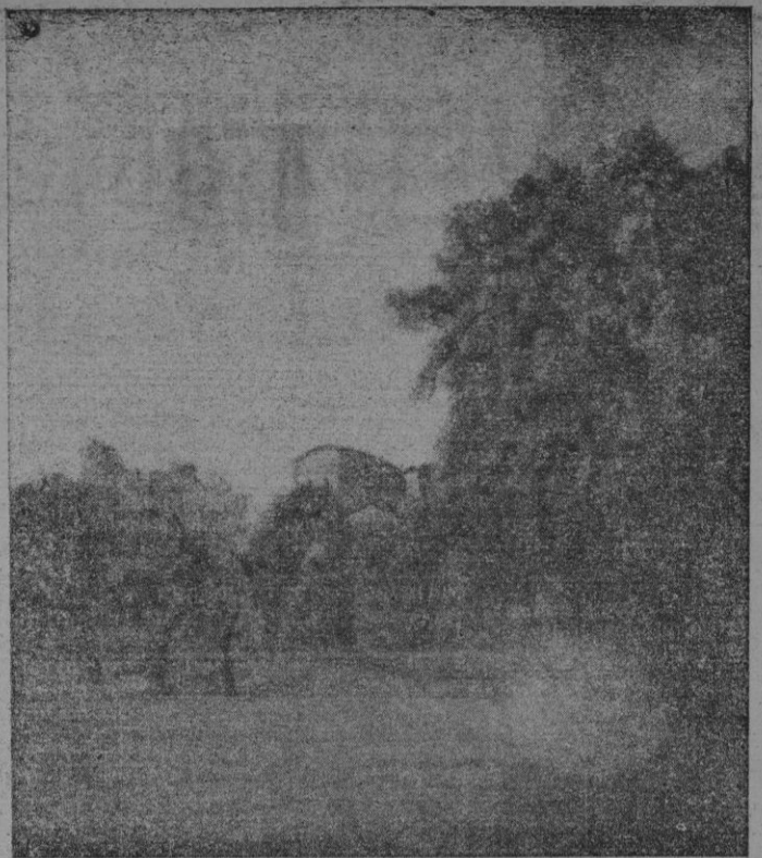
"So'n Reus" (Panda), cuadro de Francisco Vanrell, expuesto en las Galerías Meliá.

Anotemos, como dato de mayor relieve, la constancia con que el público acude, interesado a esa modalidad de exposiciones que le permiten adquirir obras por precios asequibles.