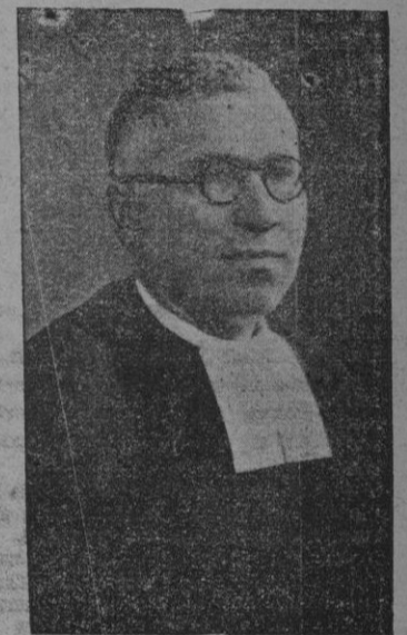
El Hermano Joaquín (Tarragona) objeto del segundo milagro aprobado para la beatificación.

Gran número de fieles, en su mayoría ex-alumnos de los Hermanos de La Salle, procedentes de las cinco partes del mundo y entre los cuales está una representación de Mallorca y Menorca, se aprestan para presenciar en el Centro de la Catolicidad, y dentro del magnífico marco de la cúpula de San Pedro, el momento solemne y