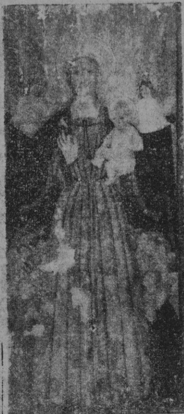
tabla pintada; el color atzur ya no se distingue, sólo los dorados y los colores claros; a uno y otro lado de la figura se ve molta gent; a la derecha, personajes coronados y mitrados y, a la izquierda, gente del pueblo.

En el contrato citado se estipuló que "lo dit Moger haje e sia tingut a donar la post de Nostra Dona, desde vuy (26 Enero) a la festa de Sant Joan de Juny primer vinent". De las demás figuras que pintó Moger para aquel retablo no ha quedado sino ésta. Aquel retablo estuvo colocado desde aquella fecha hasta el año 1634, unos ciento veinte años; en la visita del Obispo Santander que hizo en aquel año, mandó se hiciera un retablo nuevo en vista de ser el