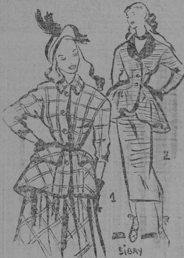
1. En lana escocesa roja y verde, billar, con cinturón de cuero rojo. Caderas arriba las muy marcadas. Falda larguísima, plisada. — 2. En algodón de fina color fresa con solapas de terciopelo. Piezas muy truncadas en la cadera. Falda tubo.

porque son positivamente auténticas creaciones. Si París tiene un Museo del Louvre que se ve muy visitado por los creadores