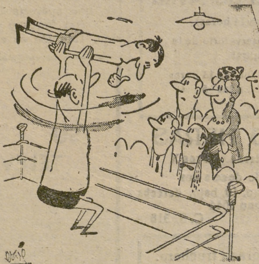
—Sobre el sombrero de esa que se ríe...

...es una cosa serial! DISTRIBUIDOR EXCLUSIVO TV Iberia García & San Frutos, S. L.