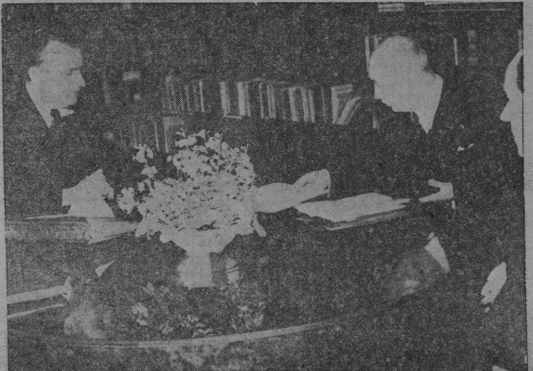
Gottwald se entrevista con el presidente Benes para darle cuenta del ultimatum comunista que convierte a Checoslovaquia en un satélite más del numeroso cortejo de países vasallos de la U. R. S. S.