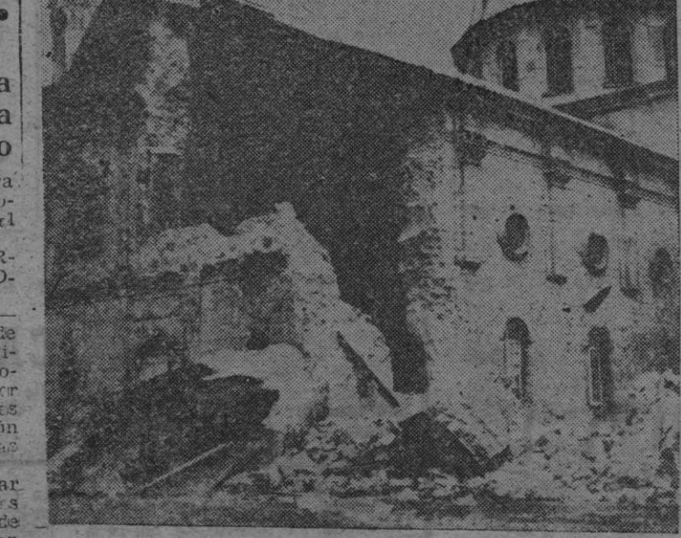
Estado en que quedó la iglesia de la Inmaculada Concepción en la población de Opón, después del último terremoto en la isla de Panay