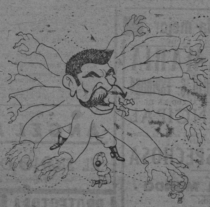
LA ARARA EUROPEA