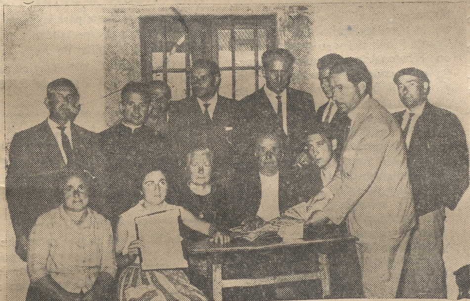
Acto de Santa Cruz de Pinares

Quisiéramos destacar otras cifras que son garantía del desenvolvimiento económico de esta prestigiosa Entidad, así como de su filial CENTRAL DE SEGUROS, S. A., que con tanto acierto viene desarrollando sus actividades en nuestra provincia, pero ello no nos es posible por carecer de espacio suficiente en nuestras columnas.