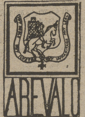
MERCADO DE FERIA

El acto se iniciará a las ocho de la tarde. La entrada será pública.