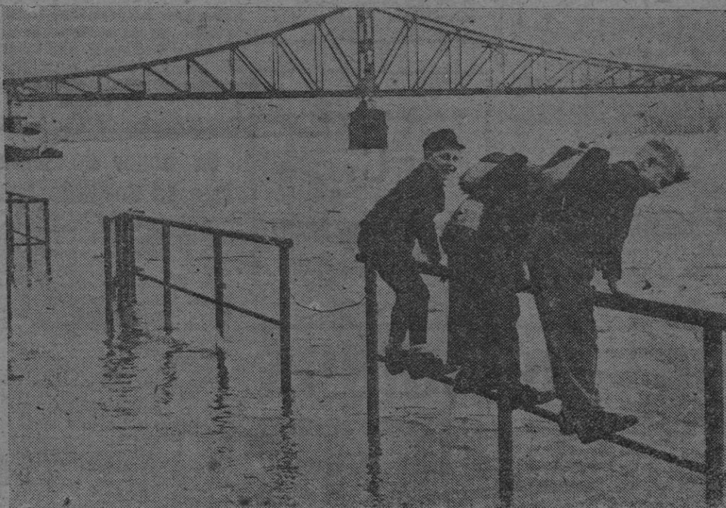
Los ríos Main y Rin se han desbordado, inundando extensas regiones del sur y oeste de Alemania. El «lago» que reproducimos, no es más que un ejemplo de la magnitud de la riada que afluye fuera del cauce del río Main, en Frankfurt, donde estos niños aprovechaban —para ellos feliz ocasión— de jugar a ver quien primero se moja los pies...