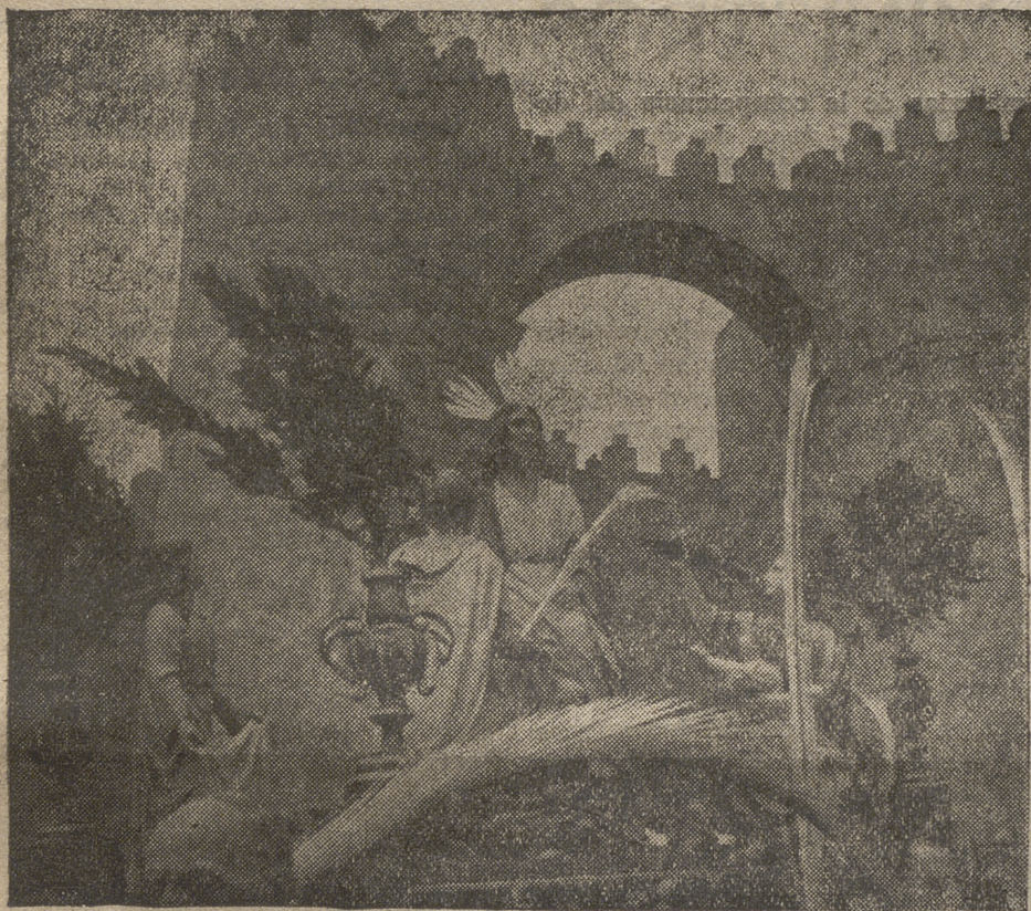
Paso de Jesús en la Borriquilla

contentos hasta el Maestro, y son ellos los que, al pasar por entre las tiendas de los acampados peregrinos, comienzan a alfombrar las calles y a gritar: ¡Bendito el que viene en el nombre del Señor!, dice una voz aguda, y es el grito bíblico de ansias mesiánicas. Las gentes, buenas en el fondo, sencillas y humildes para recibir y reconocer al Señor, corean con sus vivas: «¡Hosanna!», ¡«Hosanna al Hijo de David!», ¡«Bendito el que viene en el nombre del Señor!»! Unos cortan ramas de los olivos y las tienden al paso del Señor; los de Jerusalén salen con palmas en sus manos para dar la bienvenida al Rey Mesías. Todos contentos, gritan, alaban al Señor con su entusiasmo, acompañan al Rey de Paz que entra por vez última en la Ciudad Santa para actualizar en este día lo que, a través de los siglos,