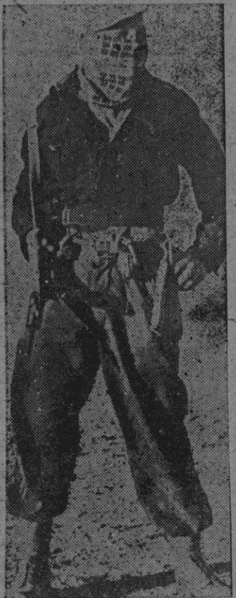
Los voluntarios judíos del «Haganah» disponen de un armamento muy primitivo, como podemos apreciar en el equipo de este miembro suyo, el cual va provisto de armas automáticas y granadas de mano; llevan la cara tapada para no ser reconocidos.