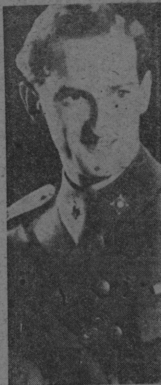
Se ha anunciado que el príncipe Oluf, hijo del príncipe Harald de Dinamarca, ha renunciado sus derechos al trono de su país, para casarse con la señorita Dorrid Blugard Muller. Actualmente, el príncipe ostentaba el título de conde de Rosenberg.