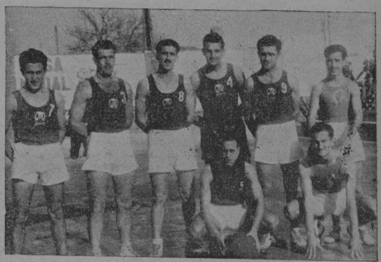
El Hispania, campeón balear de baloncesto.

El domingo luchó con el más flojo de los equipos que han tomado parte en el campeonato, y como pro-