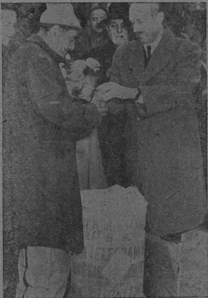
Ha llegado a Roma el primer envío de víveres americanos constituido por el «Tren de la Amistad». Reproducimos un momento del reparto de las 5.000 toneladas de víveres, por el promotor Drew Pearson en el Ayuntamiento de Roma, con la asistencia del Primer Ministro, Alcides de Gasperi, y el Ministro de Relaciones Exteriores, Conde Sforza (centro)