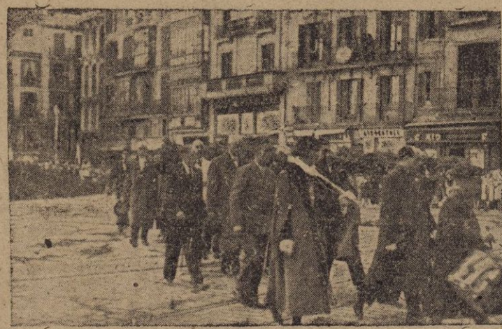
El traslado del asta del Pénion del Rey Don Jaime por los Concejales del magnífico Ayuntamiento en la Plaza de Cort.