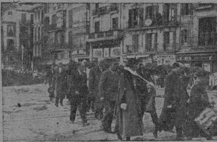
El traslado del asta del Pendón del Rey Don Jaime por los Concejales del magnífico Ayuntamiento en la Plaza de Cort.