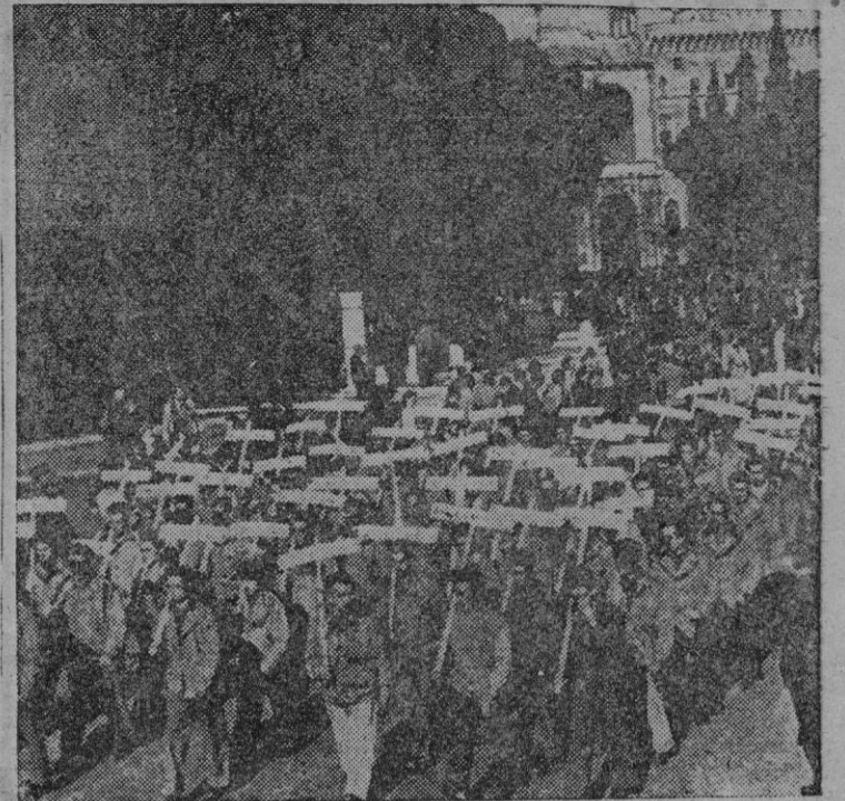
También en Italia ha fracasado la intona comunista. Aquí vemos a algunos de los treinta o cuarenta mil guerrilleros «simbólicos» que desfilaban por las calles de Roma... hasta donde les dejó llegar la policía.