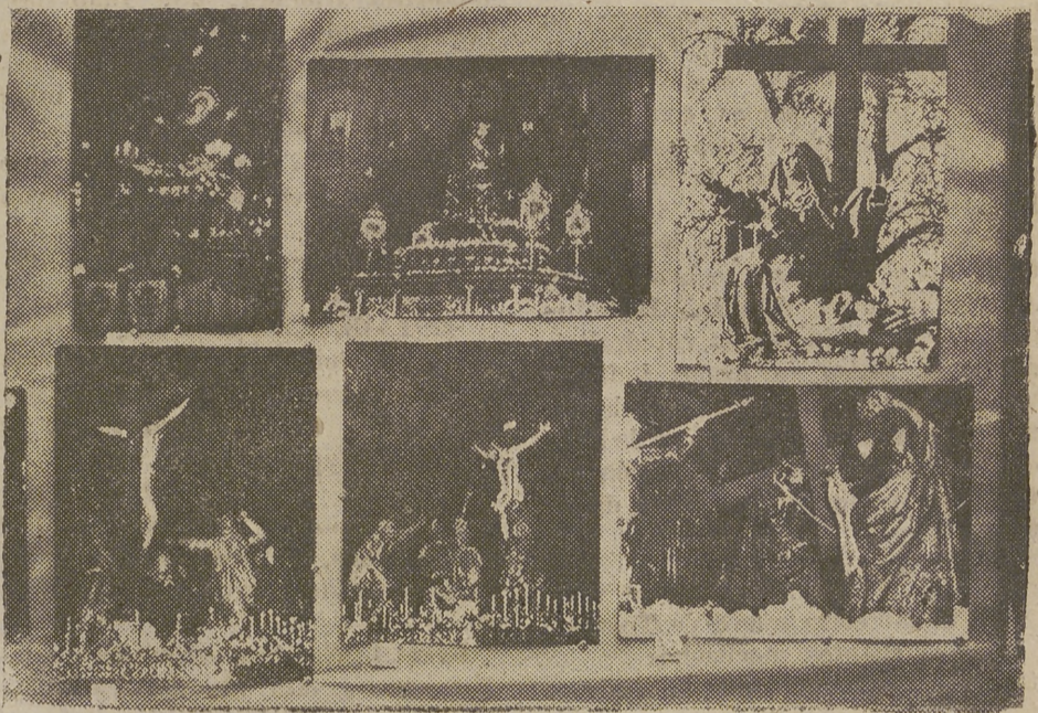
Un aspecto de la exposición de fotografías de la Semana Santa vallisoletana que se exhibe en el Palacio de Cristales del Ayuntamiento madrileño, organizada por la Sociedad Fotográfica de Valladolid y con la colaboración del Ayuntamiento de Madrid y la Tertulia Vallisoletana.—(Foto Cifra Gráfica).